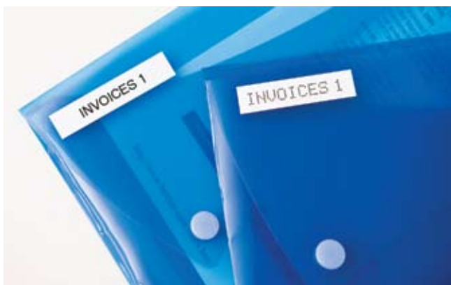
Beschriften Sie Ihre Ordner zur Identifizierung wichtiger Dokumente