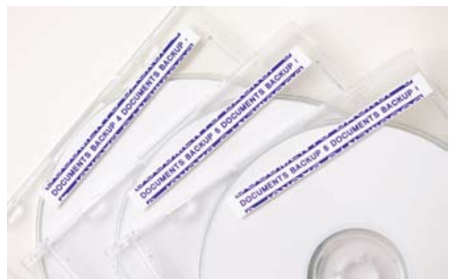
Finden Sie schnell die gewünschte CD oder DVD durch eindeutige Beschriftung der Hüllen