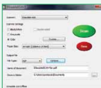
Brother DSmobileSCAN II