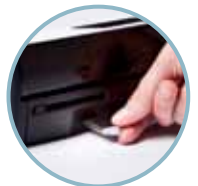
Skanna till USB