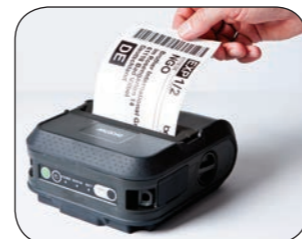
Mångsidig - skriver ut upp till 118 mm breda etiketter och kvitton.