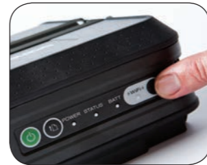
USB, seriell, Bluetooth eller trådlös nätverksanslutning.

Lätt, kompakt och ergonomisk design, gör att skrivarna i RJ-serien passar på platser där utrymmet är begränsat, tillbehör finns tillgängliga för montering i ett fordon eller bärbar användning på fältet.