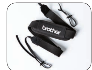
Axelrem eller bälteshållare är praktiskt vid utskrift på fältet.