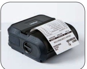
Pålitlig direkt thermoteknik, använder färre rörliga delar vilket resulterar i lägre underhålls- och driftskostnader.