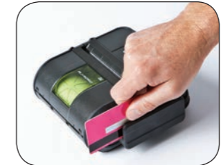
Använd tillbehöret magnetkortläsare för bearbetning av kreditkortstransaktioner.