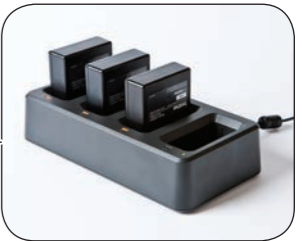
Val av strömförsörjning inklusive uppladdningsbart batteri, nätadapter eller bilmonteringsatts.