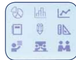
14 fonttia ; 99 tekstikehystä Yli 600 symbolia