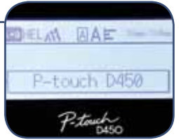
Grafiikkanäyttö tulostuksen esikatselulla