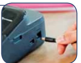
Toimii paristoilla (6 x AA) tai mukana toimitettavalla AC-verkkolaitteella