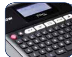
Käyttäjäystävällinen PC-tyylinen näppäimistö