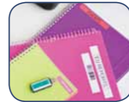
Tulostaa 3.5 - 18 mm leveille tarranauhoille

Tämä monipuolinen tarratulostin on ideaalinen työväline toimistoon ja auttaa sinua ja työkavereitasi järjestyksen ylläpidossa. Kestävillä P-touch tarroilla luotte selkeät merkinnät ja asiat on helppo tunnistaa.