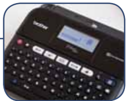
Sisältää muokattavia tarramalleja