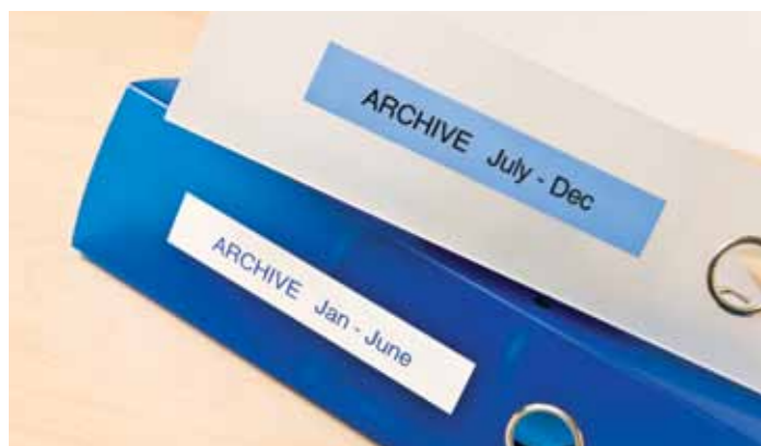
Selkeästi merkityistä kansioista löydät tärkeät asiakirjasi.

P-touch 2030VP sisältää 55 valmiista kuvallista tarramallia. LCD-näytöltä voit katsoa kaikki tarramallit vain muutamaa painiketta painaen, valita haluamasi ja tulostaa. Koko prosessi kestää vain muutaman sekunnin. Käytössäsi 18 kielen valikoima, joten voit käyttää tarratulostuksessa haluamaasi kielivaihtoehtoa.