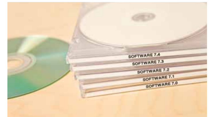
Saatavana laaja tarraleveys- ja värivalikoima, joka soveltuu moneen eri käyttötarkoitukseen.