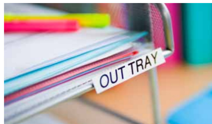
Selkeät merkinnät lisäävät toimistosi tehokkuutta.