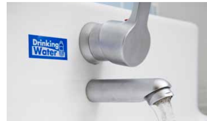
"Label Collection" 55 valmiista mallia sisältävät yleisimmin käytetyt merkit.