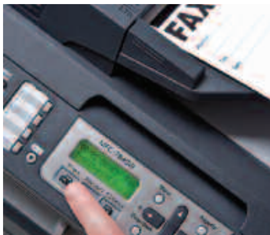
Automatische document invoer – ideaal bij het faxen, kopiëren of scannen van meerdere pagina's.