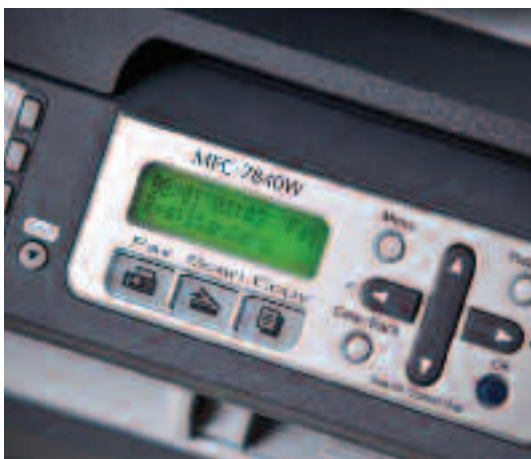
Duidelijk verlicht LCD display.

De administrator kan de toegang tot de verschillende functies van de machine beperken, zodat alleen gebruikers die de machine nodig hebben toegang krijgen. Toegang kan eenvoudig worden verleent met een PIN code van 4 cijfers.