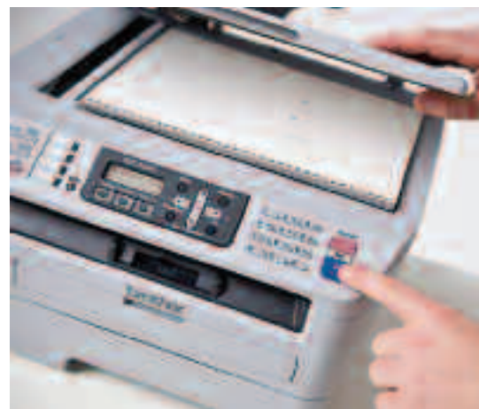
Fax, kopieer of scan uw ingebonden documenten.

De MFC-7440N heeft standaard alle functies die aan uw groeiende eisen tegemoet komen.