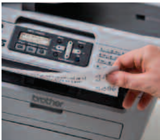
Snelle, hoge kwaliteit mono prints.