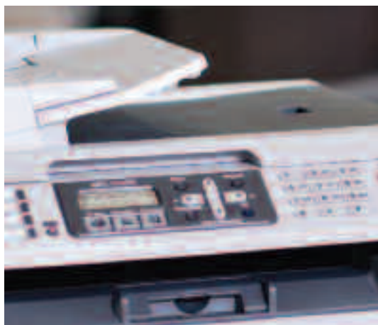
Automatische document invoer – ideaal bij het faxen, kopiëren of scannen van meerdere pagina's.

Ga naar http://solutions.brother.com voor meer informatie.