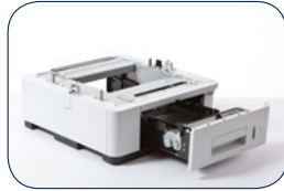
LT-7100 Optionele extra papierlade voor 500 vel (maximaal 3)