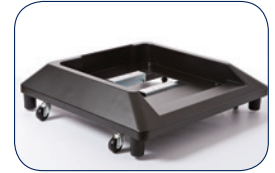
SB-7100 Stabilisatievoet Aanbevolen voor meer stabiliteit, wanneer er 2 of meer optionele extra papierladen geïnstalleerd zijn.