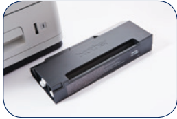
HC-05BK Inkcartridge circa 30.000 pagina's 1