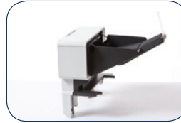
MX-7100 Optionele papieruitvoer voor 500 vel (maximaal 1)