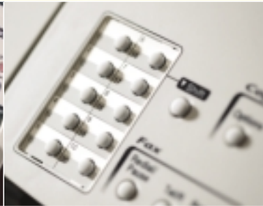
20 direct kiesnummers