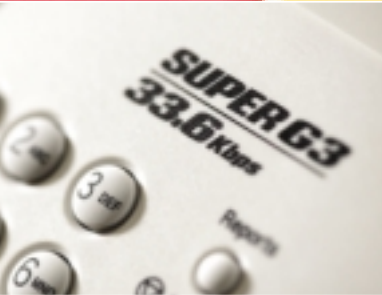
Super G3 laserfax