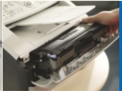
Gescheiden drum en toner