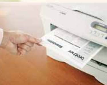
Hoge printsnelheid 20ppm