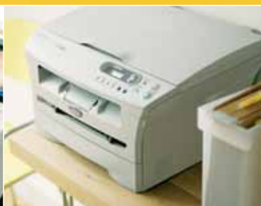
Stijlvol en compact