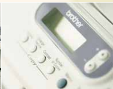
Kopieën van hoge kwaliteit