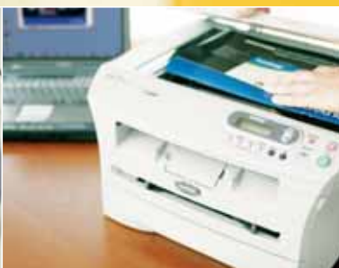
In kleur scannen van gebonden documenten