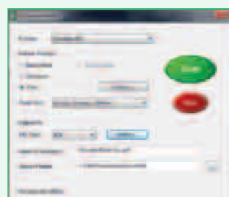
Brother DSmobileSCAN II