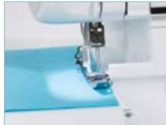
Heldere LED verlichting