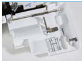
Geïntegreerd accessoires opbergvak