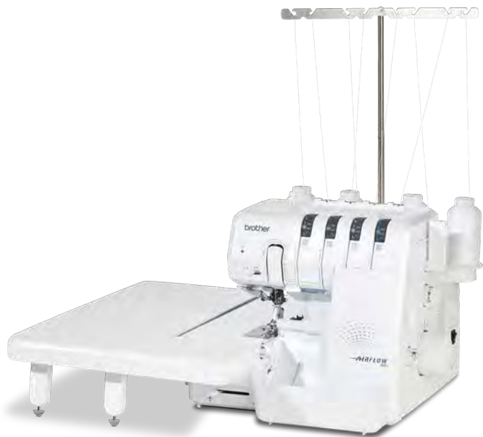
Grote verlengtafel - voor perfecte ondersteuning. (afzonderlijk verkrijgbaar)