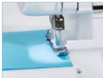
Piano di lavoro illuminato con luce a LED