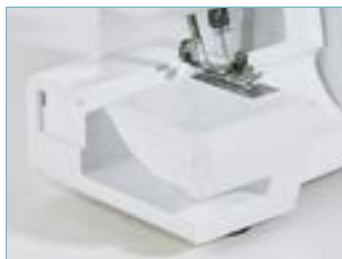
Piano di cucitura modificabile in base piana e a braccio libero