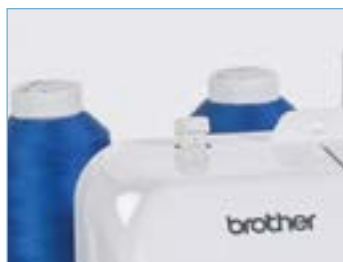
Regolazione della pressione del piedino