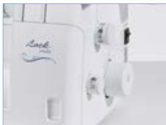
Facile accesso alle manopole di regolazione