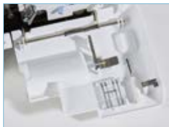
Vano accessori incorporato