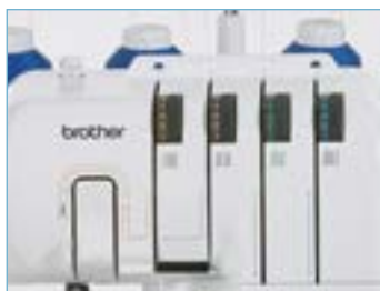
Guida all'infilatura semplificata grazie ai quattro colori