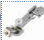
Piedino per nastri e tessuti elastici

Per attaccare nastri ed elastici a tessuti stretch.