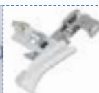
Piedino per perle e lustrini

Per attaccare perle e lustrini ai tessuti.