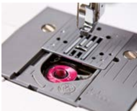
Mise en place rapide de la canette