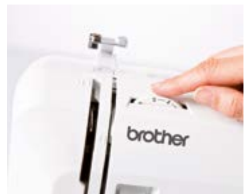
Ajustement de la tension du fil

Pour plus d'informations, contactez votre Spécialiste ou rendez-vous sur sewingcraft.brother.eu .