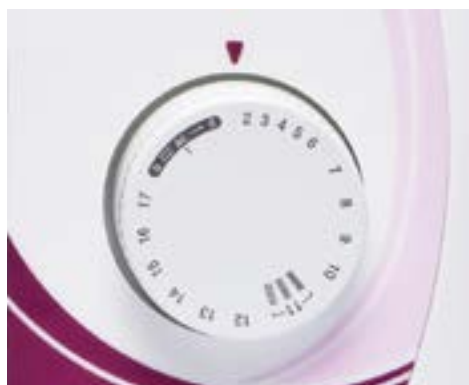
Commande simple de sélection des points