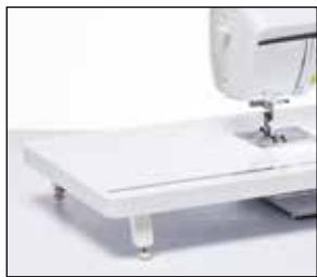
Table d'extension extra-large

Agrandissez votre plan de travail avec cette table d'extension extra-large. Idéale pour les ouvrages de quilting et de couture de grande taille. La table dispose d'une règle et d'un espace de rangement pour votre genouillère.