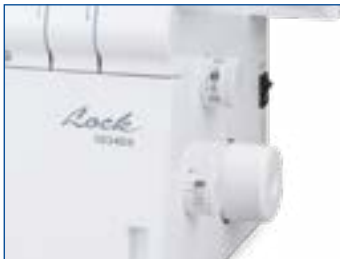
Einfache Stichweiten und -längen Regulierung über Drehrad