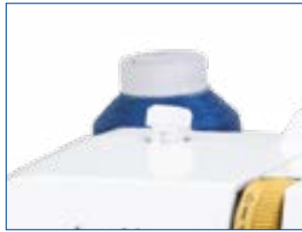
Nähfußdruck stufenlos einstellbar