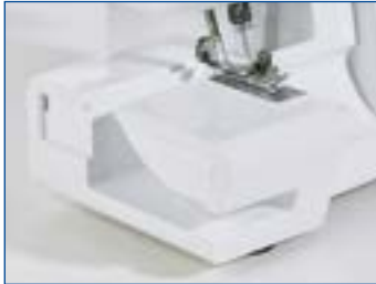
Wahlweise Nähen mit Freiarm oder Flachbett