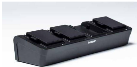
Carregador de bateria

Antes de tomar a decisão de adquirir impressoras portáteis da Brother, o Corpo da Polícia Local realizou um teste piloto com a aplicação Sanções de Trânsito que estava a ser usada na rua pelos agentes. A aplicação foi adaptada e ajustada às impressoras da Brother para obter a máxima nitidez ao fazer uma impressão. A integração foi muito simples e os agentes podem realizar o seu trabalho com segurança.