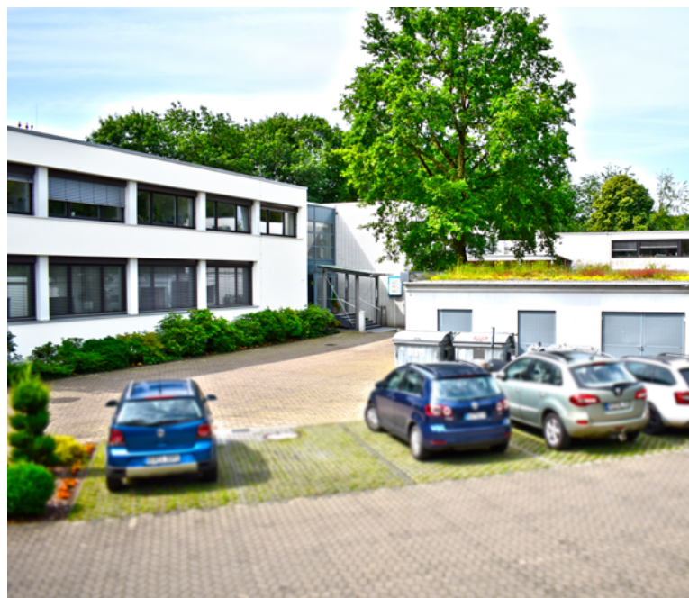
Firmensitz der Neue Landbuch GmbH & Co. KG