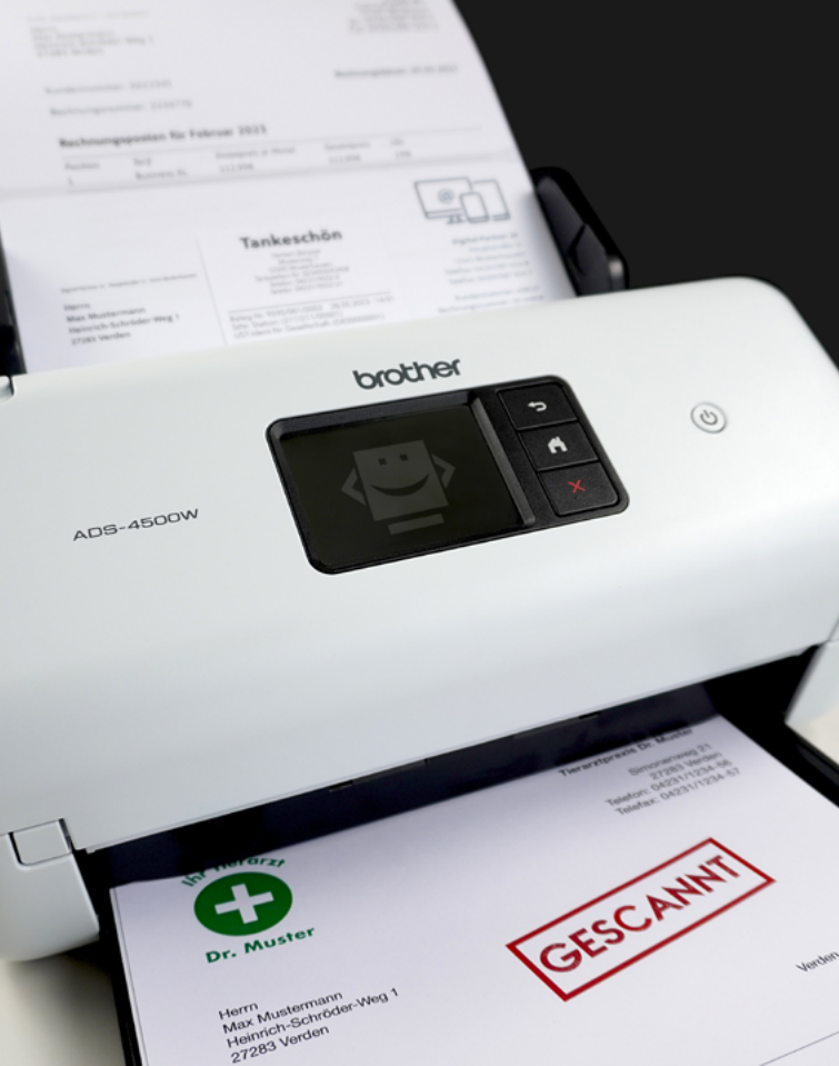
Touchscreen-Display des ADS-4500W