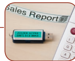
Modèles d'étiquettes intégrés pour plusieurs applications