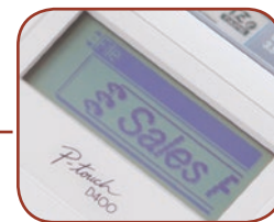
Ecran graphique avec aperçu avant impression