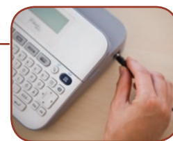
Utilise 6 x piles AA* ou adaptateur secteur (en option)