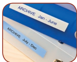
Imprime de 3,5 jusqu'à 18 mm de largeur

Les étiquettes sont disponibles en plusieurs tailles et couleurs qui permettront de répondre à tout vos besoins d'étiquetage. Grâce à sa vitesse d'impression, la P-touch D400 peut créer des étiquettes durables et lisibles rapidement.