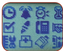
14 polices 99 cadres Plus de 600 symboles