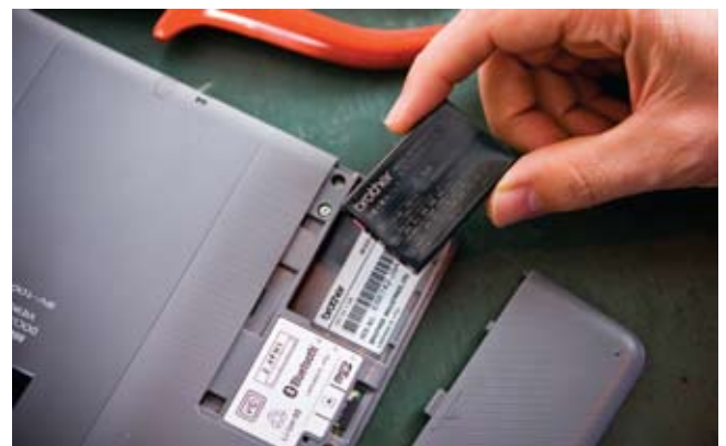
Sie können bis zu 5.000 Seiten mit nur einer Akkuladung lesen