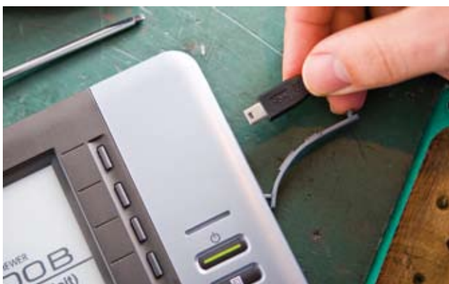
Der integrierte Mini-USB-Anschluss kann zur Datenübertragung oder zum Laden des Akkus im SV-100B verwendet werden

Dokumente können in einem von zwei Speicherbereichen abgelegt werden. Dokumente im Standardbereich können einfach geöffnet werden, während zum Aufrufen der Dokumente im sicheren Bereich eine vierstellige PIN benötigt wird. Im sicheren Bereich wird die Datei zusätzlich mit 128-Bit-AES verschlüsselt. Dieser äußerst sichere Verschlüsselungsstandard verhindert, dass die Dokumente auf einem anderen Gerät gelesen werden können.